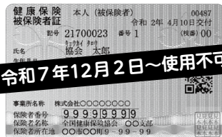
健康保険証(水色のプラスチック型)

A 12月2日以降は、健康保険証を協会けんぽに返却する必要はなく、ご自身で廃棄が可能になります。 ※廃棄の際には個人情報ですので十分ご注意ください。