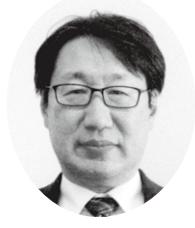
日本年金機構 北関東信越地域部 長野南年金事務所 (長野県代表事務所) 所長

結びに皆様方の益々のご活躍と事業所のご発展をご祈念申し上げ、年頭のご挨拶とさせていただきます。