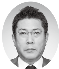
長野県社会保険協会 会長