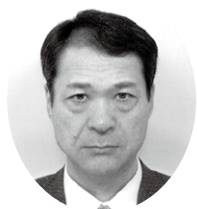
全国健康保険協会 長野支部 支部長