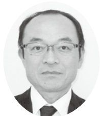
日本年金機構 北関東・信越地域第二部 長野南年金事務所 (長野県代表事務所)長

結びに皆様方の益々のご活躍と事業所のご発展をご祈念申し上げ、年頭のご挨拶とさせていただきます