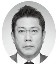
長野県社会保険協会 会長