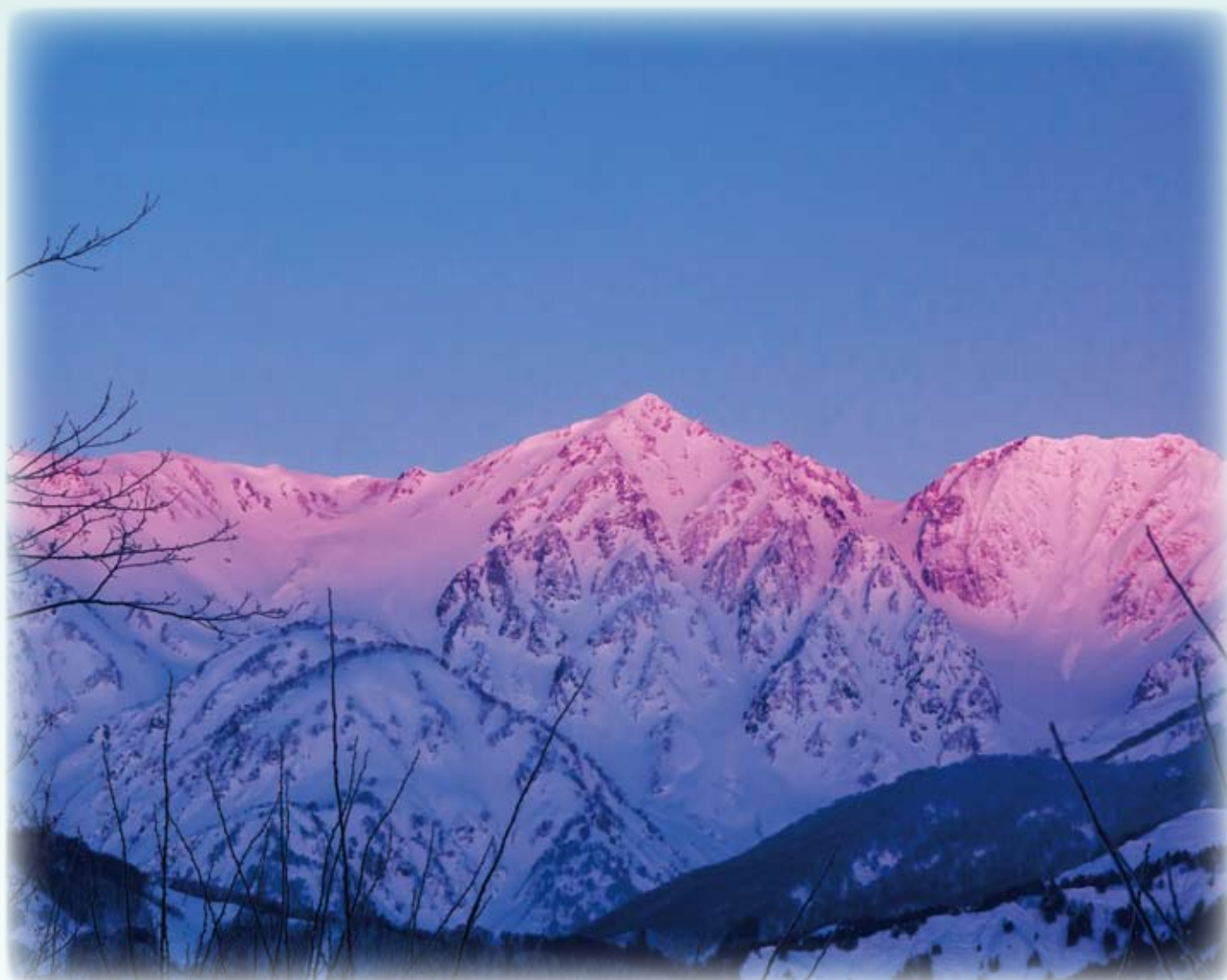
朝日に照らされる北アルプス