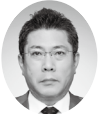
長野県社会保険協会 会長