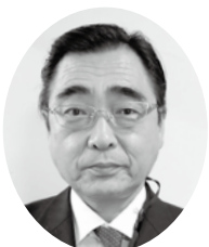
日本年金機構 北関東・信越地域第二部 長野南年金事務所 (長野県代表事務所)長

結びに皆様方のますますのご活躍と事業所のご発展をご祈念申し上げ、新年のご挨拶とさせていただきます。