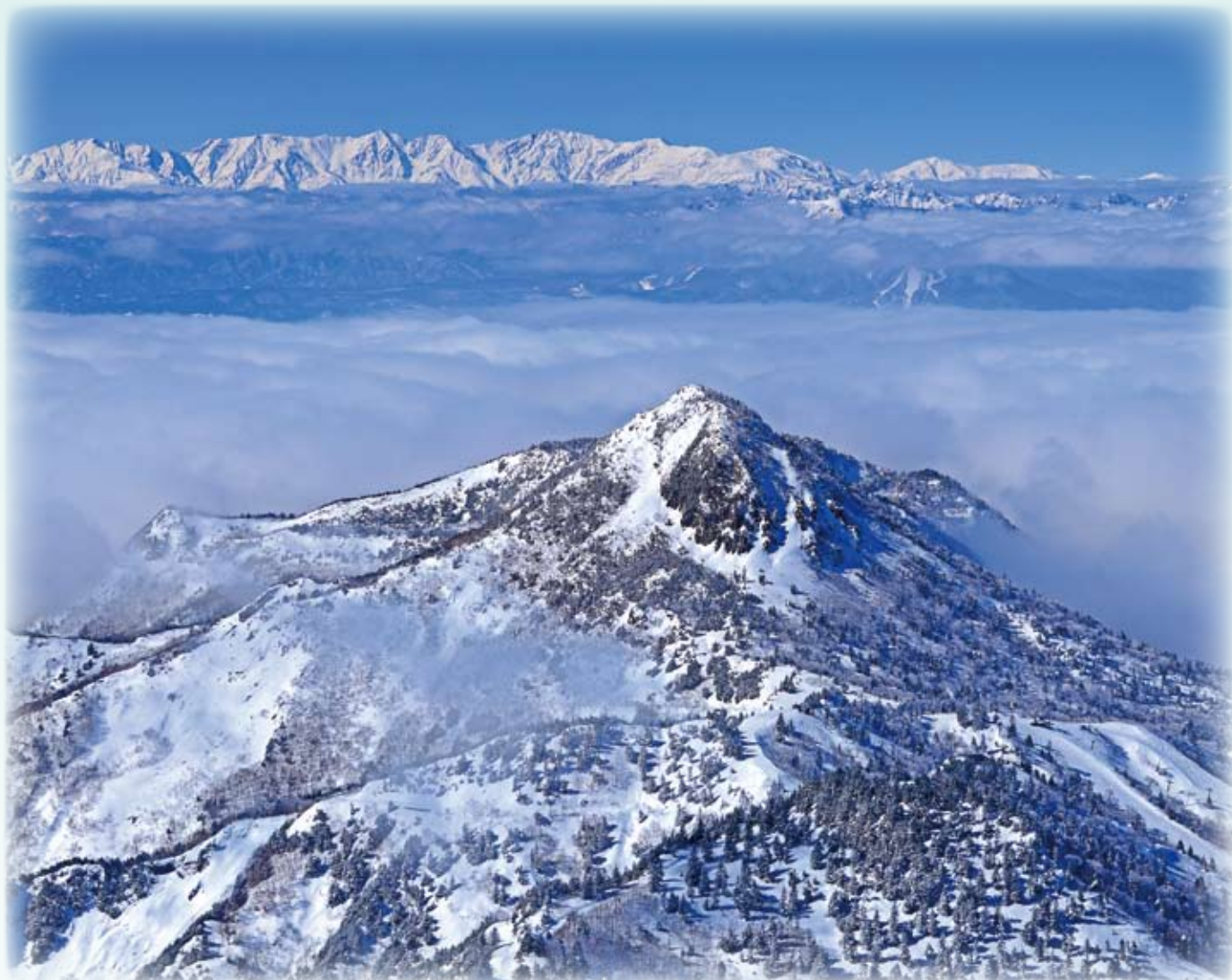
志賀高原横手山から笠岳・北アルプス展望