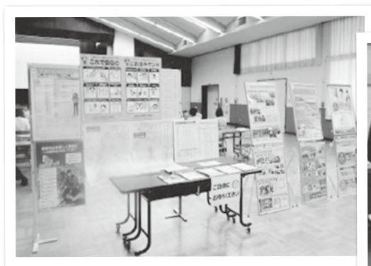
昨年の健康経営セミナーの様子