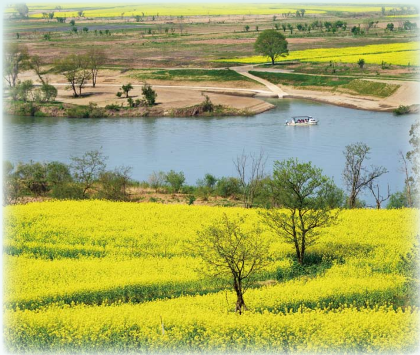
飯山市・菜の花公園