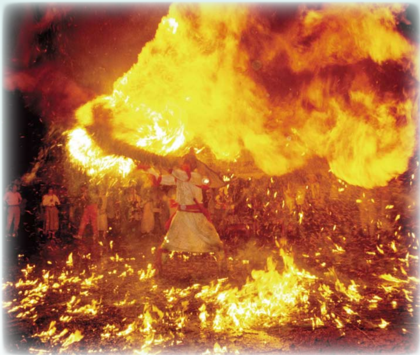
奈良沢神社 例大祭