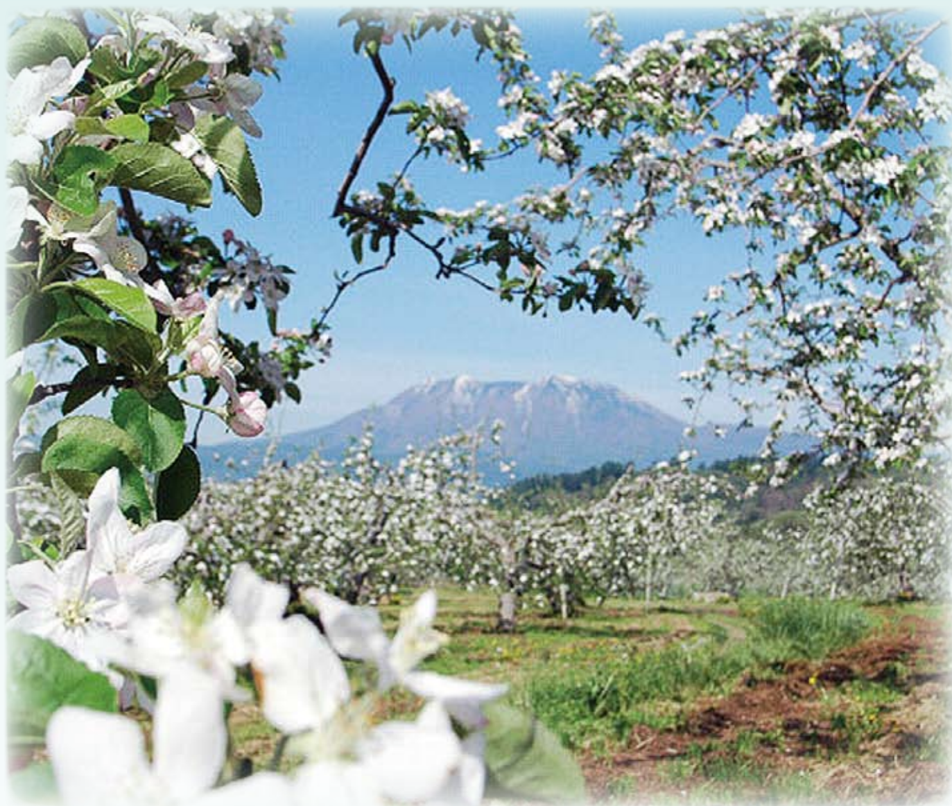
りんごの花