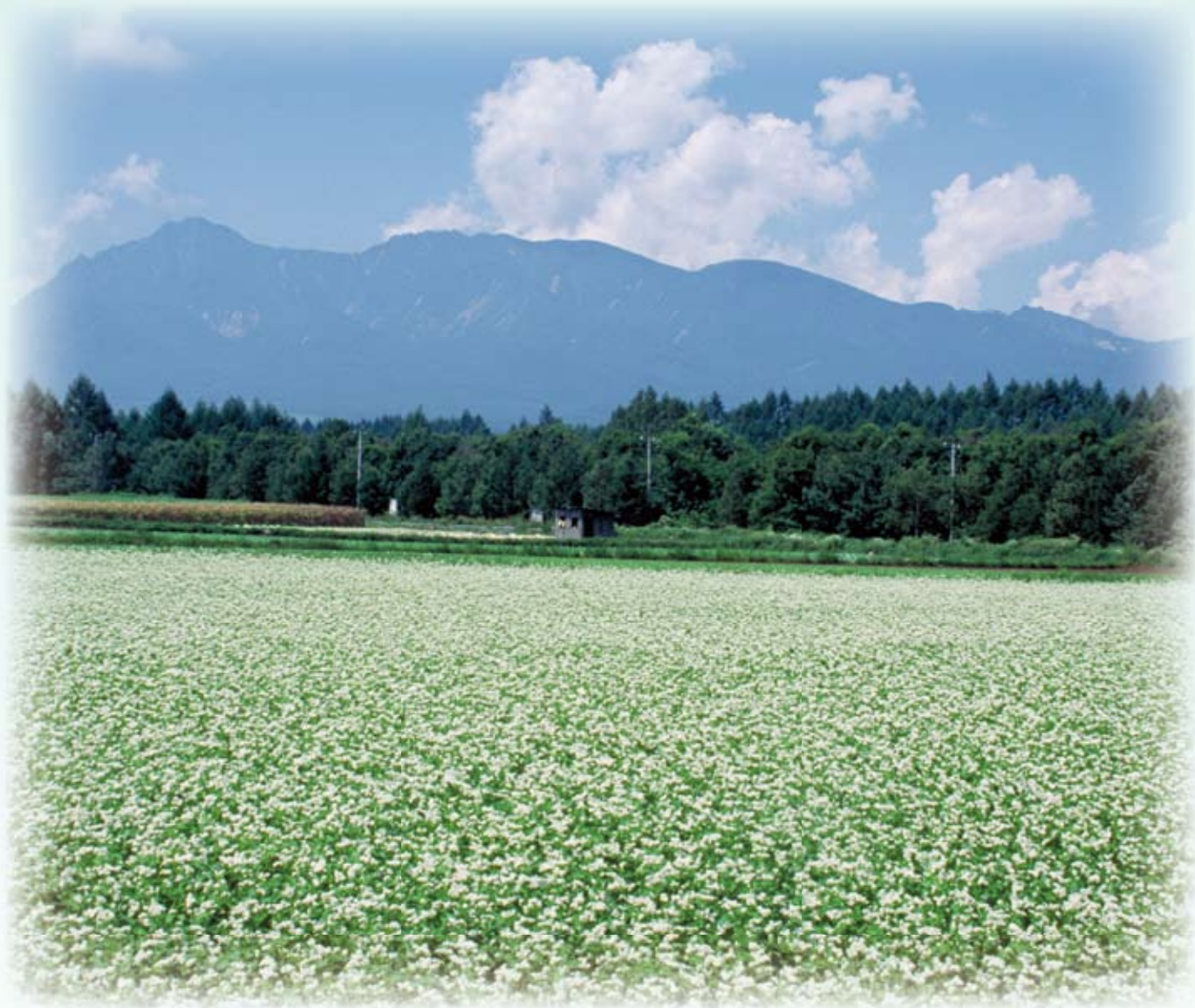
川上村のソバの花