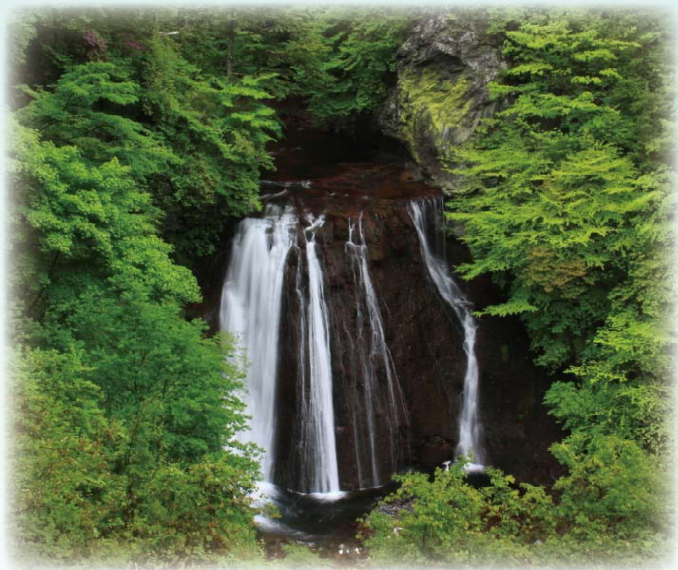
茅野市 横谷溪谷・王滝