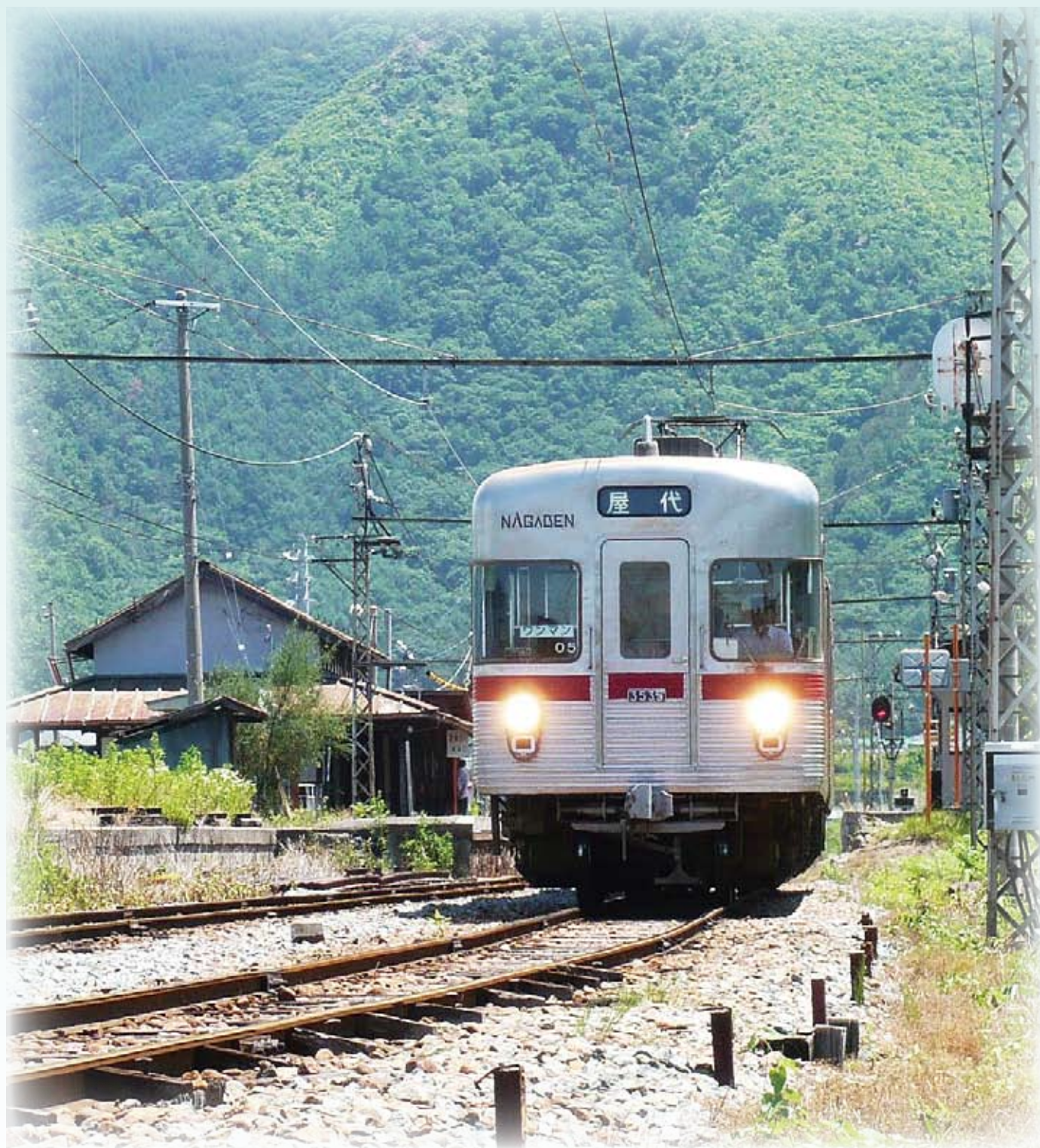
長野電鉄 屋代線 信濃川田駅付近